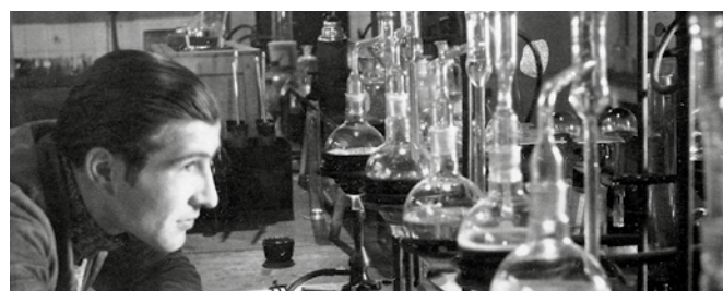
Damals wie heute – Forschung und Entwicklung gehören zu den Kernkompetenzen unseres Unternehmens.

ADDINOL bietet intelligente Lösungen, die eine optimale Schmierung sicherstellen und gleichzeitig einen verantwortungsvollen Umgang mit der Umwelt gewährleisten. Viele unserer Hochleistungs-Schmierstoffe steigern ganz entscheidend die Energieeffizienz von Anlagen und Motoren. Sie verfügen über deutlich längere Standzeiten als herkömmliche Produkte und erhöhen die Lebensdauer der geschmierten Komponenten.