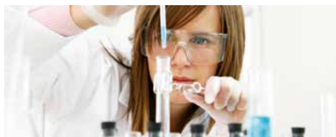
Now and then – Research and development make up a vital part of our company's core competence.