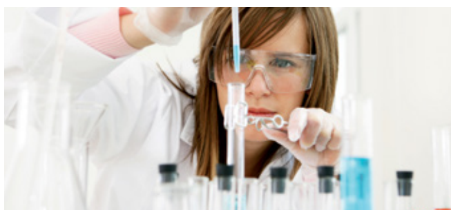
Now and then – Research and development make up a vital part of our company's core competence.