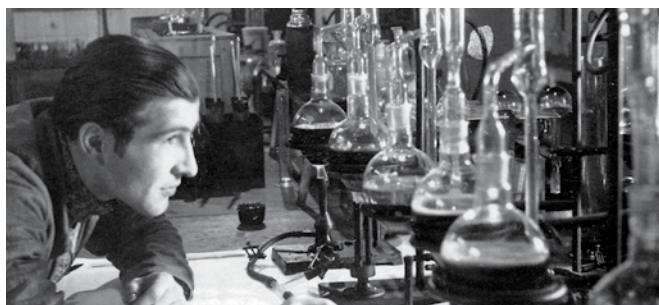
Научно-исследовательские разработки всегда занимали важное место в деятельности нашей фирмы.

ADDINOL — одно из немногих нефтеперерабатывающих предприятий Германии, действующих независимо от крупных концернов. Осуществляя свою деятельность при посредничестве дилеров и партнеров более чем в 90 странах мира, мы представлены на всех континентах. Научно-исследовательская деятельность и производство, отвечающие самым современным стандартам, сосредоточены в немецком городе Лойна, традиционном центре химической промышленности. Взаимодействуя с двигателями, приводами, цепями, подшипниками и гидравлическими системами, смазочные материалы полностью раскрывают свои мощностные характеристики. ADDINOL предлагает высокотехнические решения, обеспечивающие оптимальную смазку и заботу об окружающей среде. Многие наши высокоэффективные смазочные материалы существенно улучшают энергоэффективность установок и двигателей. Срок службы наших смазочных материалов значительно превышает срок службы обычной продукции; кроме того, они способствуют более длительной эксплуатации смазываемых компонентов.